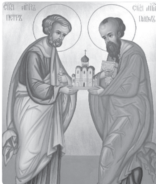
Апостолы Петр и Павел

Он был приведен к Господу своим братом Андреем, и при первом же взгляде на простого рыбака Господь преднарек ему имя Кифа, по-сирски, или по-гречески - Петр, то есть камень. По избрании Петра в число апостолов Господь посетил его убогий дом и исцелил тещу от горячки (Мк. 1,29-31). В числе трех учеников Своих Господь удостоил Петра быть свидетелем Своей Божественной славы на Фаворе,