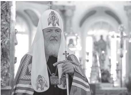
Святейший Патриарх Московский и всёя Руси Кирилл

Святейший Патриарх Московский и всёя Руси Кирилл выступил с обращением к Полноте Русской Православной Церкви, сообщает пресс-служба Патриарха. Дорогие братья и сестры, обращаясь ныне ко всей Полноте нашей Церкви, ко всем народам исторической Руси.