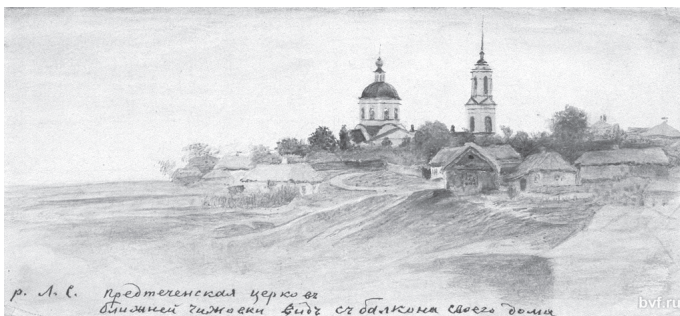
Предтеченская церковь в ближайшей Чижовке вид с близлежащего двора